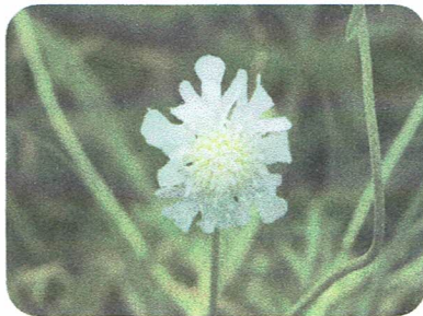
マツムシソウ (3部作) 秋の代表的な山野草 白、ピンクの花は珍しい